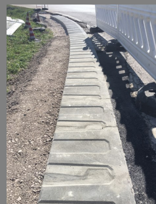
Baustelle: Gemeinde Kurtatsch (BZ) cantiere: Comune di Cortaccia (BZ)